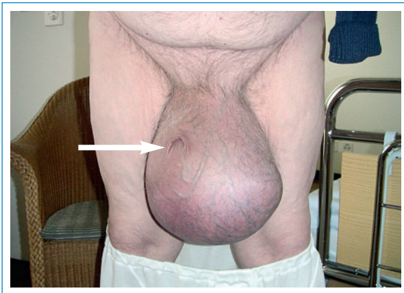
Abbildung 1 Präoperativer Zustand: riesiges Skrotum. Der Pfeil markiert die Öffnung des «verschwundenen» Penis.

Abbildung 1 zeigt das Ausmass der Hydrozele. Eine abdominoskrotale Komponente und ein Hodentumor konnten mittels CT ausgeschlossen werden. Es zeigte sich eine nur linksseitige Hydrozele vaginalis testis. Es wurde eine Hydrozelektomie nach van Bergmann mit gleichzeitiger Orchiektomie bei inkarzeriertem Hoden/ Nebenhoden vorgenommen. Die resezierte Hydrozele